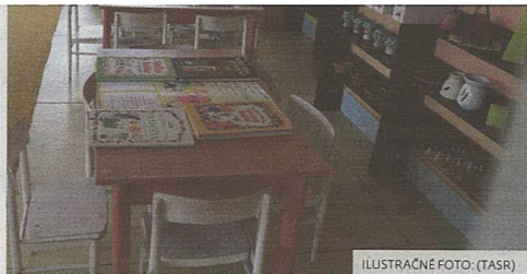
ILUSTRACNÉ FOTO: (TASR)

Lekári zaznamenali v tomto týždni 13 171 akútnych respiračných ochorení, z toho 2 750 prípadov chripky. V porovnaní s predchádzajúcim týždňom